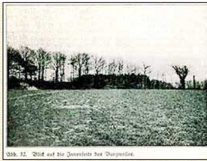
Abb. 32 Blick auf die Innenseite des Burgwalles.

Dieser Elbübergang bei Artlenburg, heute noch Fährstelle, ist vermutlich uralte. Man muß sich vorstellen, daß in frühen Zeiten die Ufer der Ströme und Flüsse weit ins Land hinein versumpft waren und ein Herankommen an das Ufer selten ermöglichten. Nur da, wo sich Sand- oder Steinrücken des Bodens durch den Sumpf bis dicht an die Ufer heranschoben, war ein Uebergang über den Fluß möglich, Hier bei Artlenburg treten nun von beiden Seiten