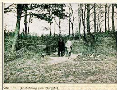
Abb. 31 Zufahrtsweg zum Burgplatz.

Dieser Burgplatz ist eine ebene, jetzt beackerte Fläche, nach der Elbe zu in fast gerader Linie als Kante des Steilhanges abschließend, etwa 110 m lang, 67 m breit, auf der Landseite durch einen hohen Wall mit davorliegendem Graben in gebogener Linie begrenzt. (Abb. 1 ) Die Enden des Walles stoßen nicht bis zur Kante des Steilhanges vor; im Norden fehlt der Wall auf eine Länge von 52 m von der Elbseite her ganz, auf der Südseite läuft er, einmal eine kurze Strecke