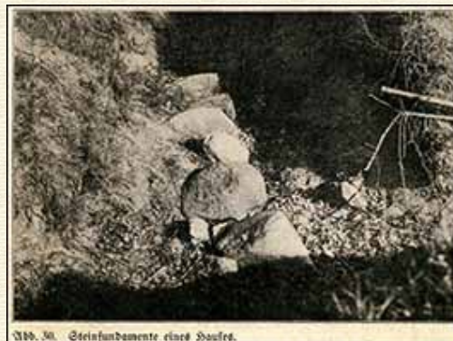
Abb. 30. Steinfundamente eines Hauses.

Ein senkrecht zu Graben V gezogener Stichgraben ergab in 2,5 m Entfernung vom jetzigen Wallfuße eine Reihe von großen Findlingen in etwa 1 m Tiefe, anscheinend regelrecht angeordnet, ohne Mörtel, und zweifellos die Fundamente eines Hauses darstellend. (Abb. 30.) Eine Umbiegung der Steinreihe fand sich nicht. Ueber den Steinen lagen wenige graue, hartgebrannte und einige dickwandige, gelbrote, schwachgebrannte Scherben.