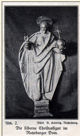
Abb. 2. Die silberne Christusfigur im Ratzeburger Dom.

Das Innere des Altarschranks zeigt in der breiten Mitte unten ein buntes Steinbild, die Leidensgeschichte Christi. Es wird in einem späteren Abschnitt besonders behandelt werden. Der Raum daneben und darüber enthält 12 Nischen für die Apostel und eine größere Mittelnische oben für den "SALVATOR MUNDI". Ausgeschnittene vergoldete Blechrahmen, barock und wenig schön, in denen sich wiederholt die Initialen Bülows: H. H. v. B. vorfinden, bilden die Umrahmungen, vergoldete Tapeten den Hintergrund.