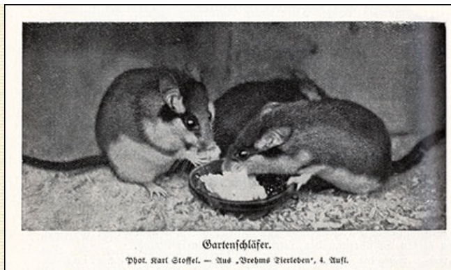
Gartenschläfer. Phot. Karl Stoffel. - Aus "Brehms Tierleben", 4. Aufl.

Am seltensten ist bei uns der Gartenschläfer, ELIOMYS QUERCINUS L., auch wohl Eichelmaus, Tagschläfer oder große Haselmaus genannt. Er ist eines unserer farbenfreudigsten heimischen Säugetiere, im Wesen aber fast ebenso mürrisch und bissig wie der Siebenschläfer meistens. Das von Peters (Heimat 1891 ) von Krummendieck nach der Erinnerung als Gartenschläfer beschriebene Tier möchte ich eher für eine Gelbhalsmaus halten. Die ersten besser brauchbaren Angaben über den Gartenschläfer macht Benick: "Im Februar 1922 fand der hiesige Ornithologe W. Hagen in dem östlich von Lübeck gelegenen Forstort Schwerin, einem mit alten Eichen bestandenen Waldteil, in der Astgabel einer mittelgroßen Eiche ein etwa 20 em im Durchmesser haltendes Nest, das im Naturhistorischen Museum Lübeck aufbewahrt wird. Es besteht fast vollständig aus Heu, nur mit wenig Buchenblättern untermischt, und enthält auch im Innern kein Moos. Da das Nest am Waldrand freistehend gefunden wurde, Eichhörnchen und Vögel als Besitzer nicht in Frage kommen, so bleibt vorläufig nur der Schluß auf den Gartenschläfer als einzige Möglichkeit übrig. Im April 1923 hat W. Hagen ein zweites, gleichgebautes